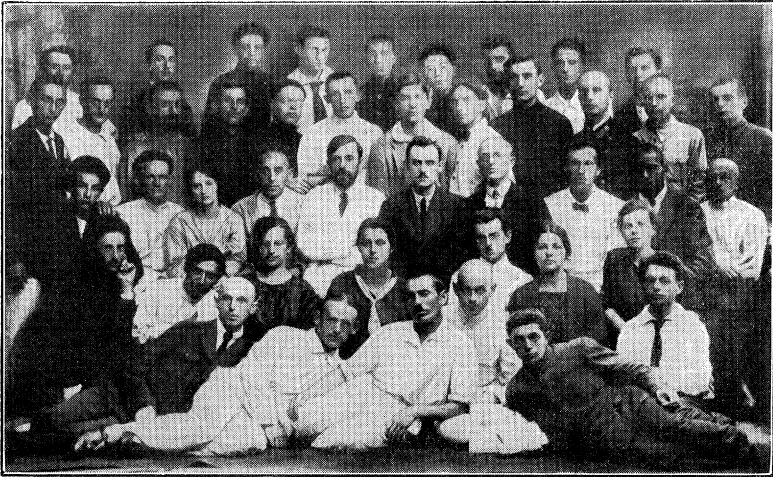
„צעירי ציון“ ארעסטירט אויף א צוזאמענפאָר אין קיעוו. זיי האָבען אָפגע- פינסטערט 2 יאָהר אין סיביר און דערנאָך פאַרבייטען אויף אײ, יעצט דאָרטיגע חלוצים.